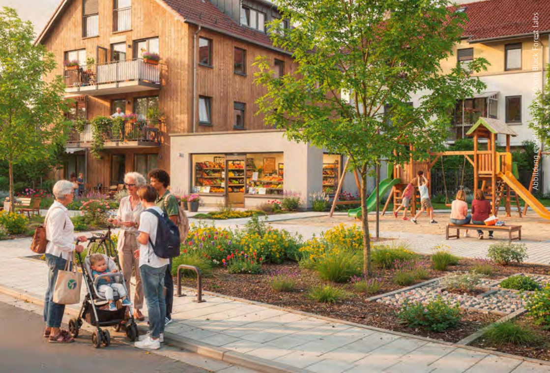
Abbildung: eysa.at und Futur 2.0 von Black Forest Labs